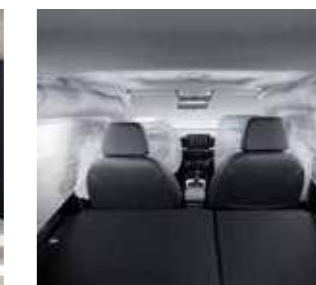
Hệ thống 6 túi khí (Phiên bản 1.0 T-GDI Đặc biệt)