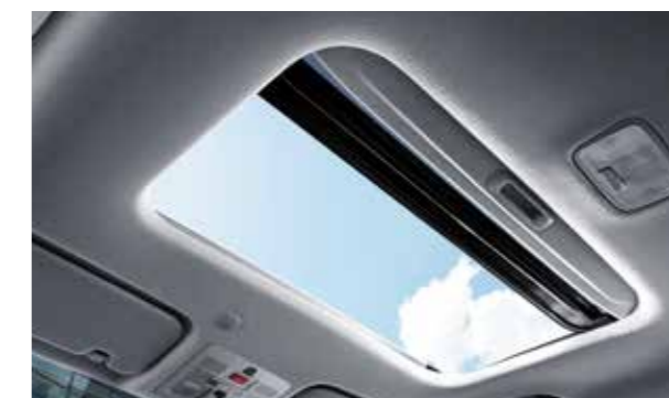
Cửa sổ trời (Phiên bản 1.0T-GDi Đặc biệt)