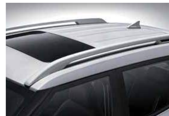
Giá nóc và cửa sổ trời (Phiên bản 1.0T-GDi Đặc biệt)