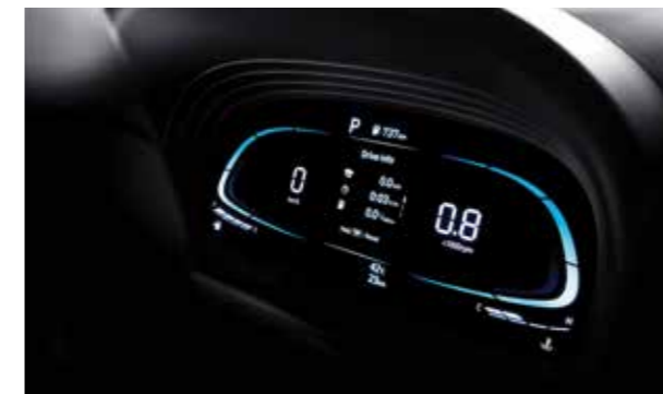
Màn hình thông tin Kỹ thuật số

Nhỏ bên ngoài nhưng lớn bên trong, VENUE mang đến không gian cabin đáng kinh ngạc với mức độ thực dụng cao cùng các tính năng hiện đại.