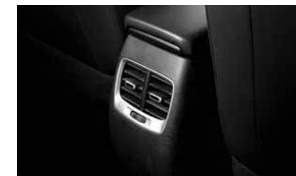
Cửa gió điều hòa hàng ghế 2