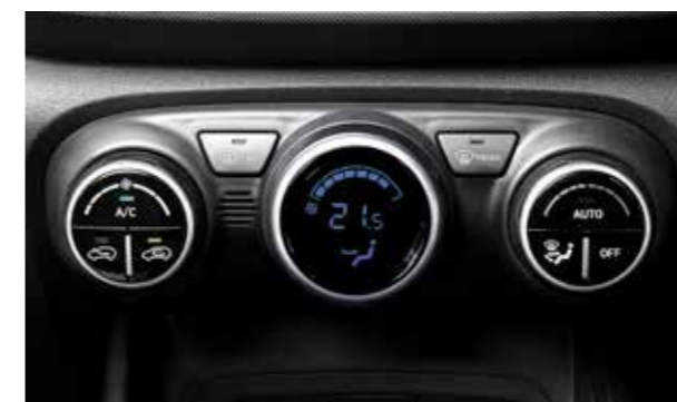
Điều hòa tự động (Phiên bản 1.0T-GDi Đặc biệt)