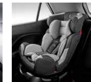
Ghế ISOFIX hàng ghế 2