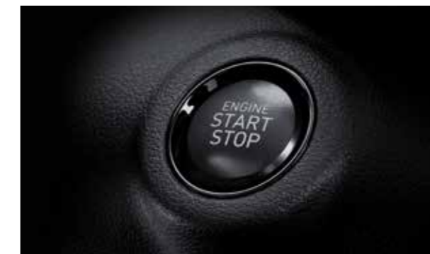
Khởi động bằng nút bấm