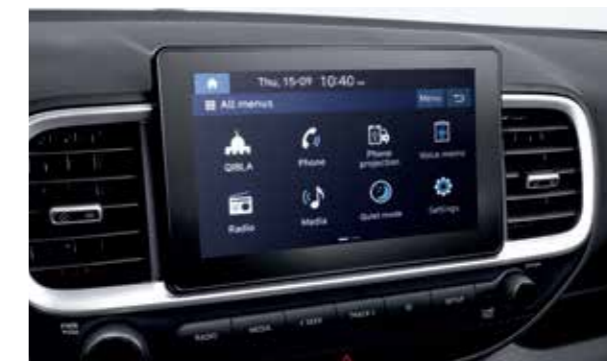
Màn hình giải trí 8 inch