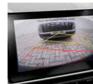
Camera hỗ trợ lùi xe