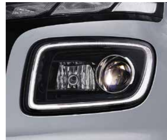
Đèn chiếu sáng LED Projector (Phiên bản 1.0T-GDi Đặc biệt)

Thiết kế lưới tản nhiệt mở rộng sang hai bên được hoàn thiện bằng Chrome bóng mang đến phong cách thể thao, mạnh mẽ cho VENUE