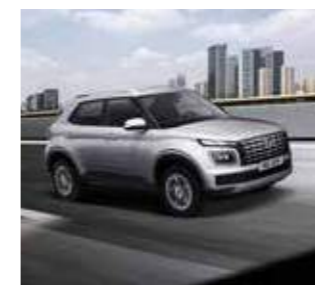
Hệ thống cân bằng điện tử