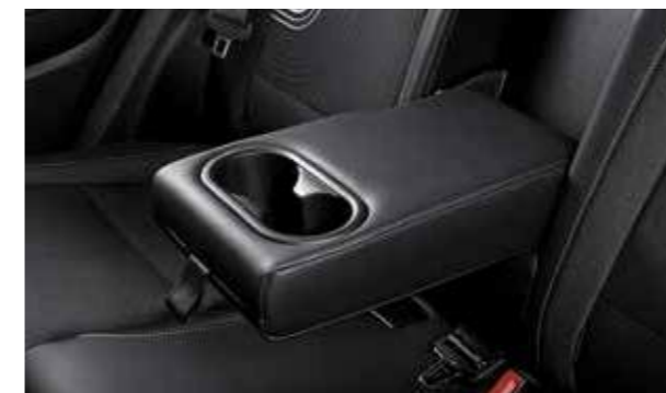
Tựa tay hàng ghế 2