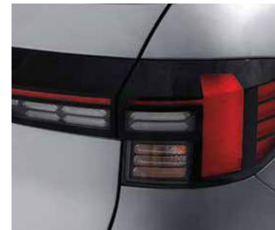
Cụm đèn hậu dạng LED