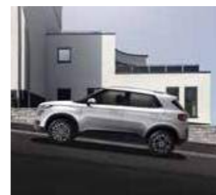
Hệ thống hỗ trợ khởi hành ngang dốc