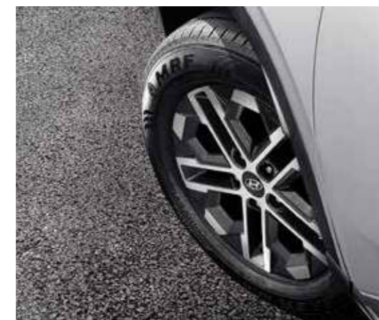
Vành hợp kim 16 inch