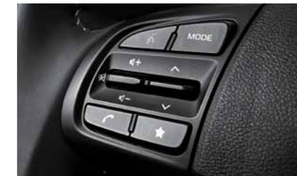
Cụm điều khiển Media