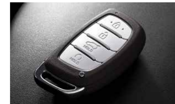
Smartkey tích hợp khởi động từ xa