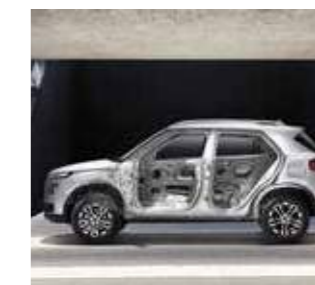
Hệ thống khung gầm chứa 65% vật liệu chịu lực cao