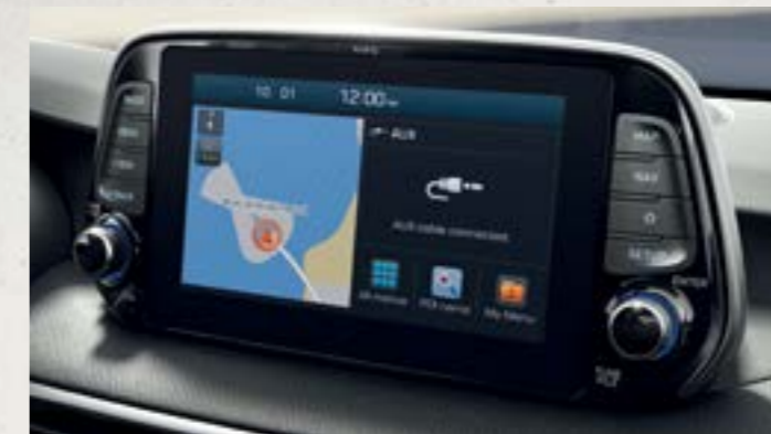
Màn hình cảm ứng 8 inch

Không gian nội thất rộng rãi và công nghệ tiện nghi bên trong chiếc xe Hyundai Tucson có thể đáp ứng mọi nhu cầu và sở thích của bạn