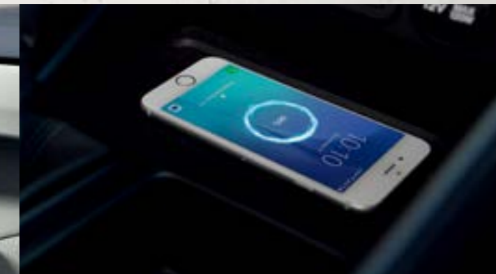
Sạc điện thoại không dây chuẩn Qi