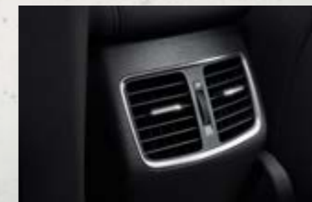
Cửa gió điều hòa hàng ghế sau