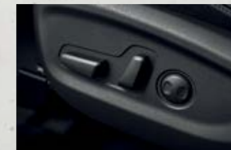
Ghế lái chỉnh điện 10 hướng