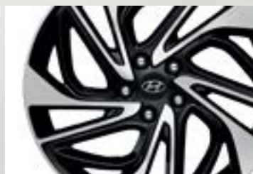
Lazang hợp kim 19 inch thể thao