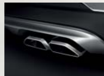
Ống xả kép