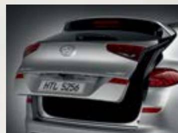
Cốp điện thông minh