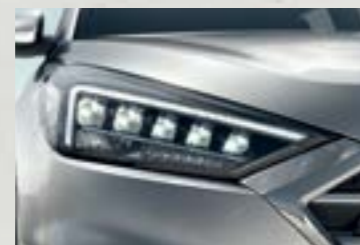
Cụm đèn pha Full LED mạnh mẽ