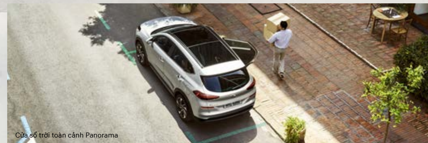
Cửa sổ trời toàn cảnh Panorama