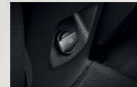
Cổng usb hàng ghế sau