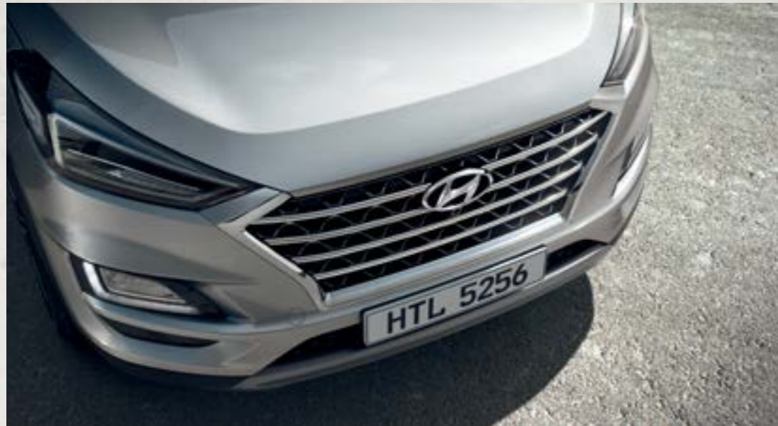
Lưới tản nhiệt dạng thác nước Cascading Grill ấn tượng