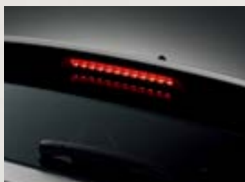
Đèn phanh trên cao