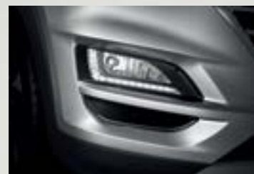
Dải đèn LED ban ngày sắc sảo